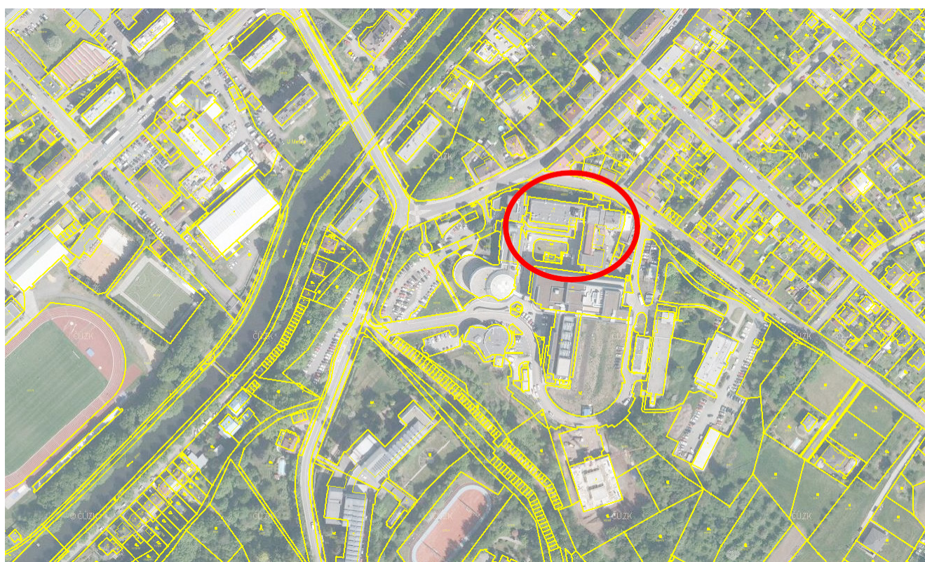
Obrázek 2: Celková situace areálu s katastrem nemovitostí - stávající stav